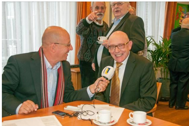
In de Vincentiuszaal wacht de pers.