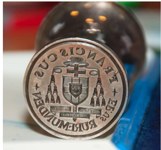
De stempel van de bisschop wacht op het belangrijkste moment: het verzegelen van de stukken voor Rome.