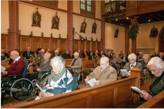
Van heinde en verre gekomen...