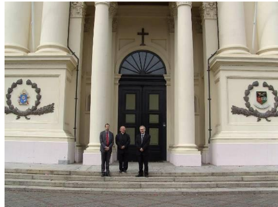
Foto: Vóór de basiliek van Oudenbosch.

Op vrijdag 14 juni vond een tweede zitting plaats in Oudenbosch met drie getuigen. Op een latere datum zullen in Nijmegen nog getuigen worden gehoord. Vanuit Oostenrijk en China zullen ook nog getuigenverklaringen bij de rechtbank worden gedeponereerd.