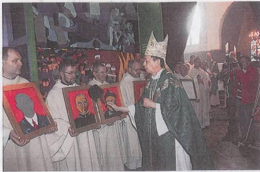
オランダのブルクハイゼンフォルストの教会で行われた殉教75周年の式典で

Uit de CATHOLIC WEEKLY OF JAPAN, 04-11-2012.