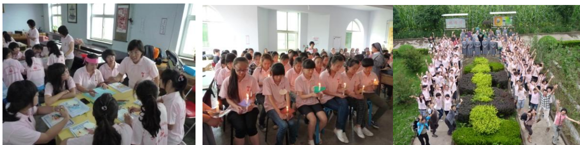
Foto's van een dergelijk kamp van afgelopen jaar in China

China Project 1 Van de katholieke organisatie ‘Caritas Taiwan’ ontving de stichting het verzoek om projecten voor meisjes in China mee financieel mogelijk te maken. Het gaat om zomerkampen in China voor meisjes van middelbare scholen. Het doel van deze kampen is de ontwikkeling van een individuele christelijke identiteit aan de hand van waarden als: de gelijkheid van man en vrouw, zelfwaardering, menselijke waardigheid, vergeving en persoonlijkheidsontwikkeling. Daarbij wil men graag het stripboek ‘Post uit China’ in het Chinees als instructiemateriaal gaan gebruiken.