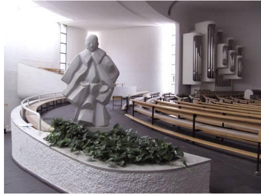
Foto: Beeld van Vincent de Paul in de kerk van Untermarchtal.

Bij het afscheid hoorden we verschillende deelnemers zeggen: 'Tot ziens bij de zaligverklaring'. Toen ook de algemene overste van de zusters van Untermarchtal deze opmerking maakte, volgde daarop de vraag: 'Zelfs als het in China plaats vindt?' Daarop reageerde ze meteen met de woorden: 'Ook dan!'. Er staat ons nog wat te wachten...