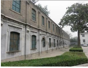
De vroegere jongensschool staat er nog.