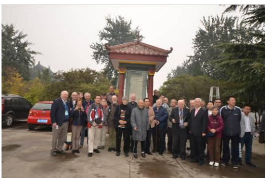
Camera's blijven klikken.