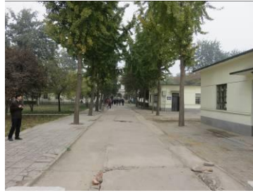
In de verte het vroegere bisschopshuis.