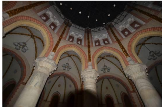
'De mooiste kerk van de hele provincie'?