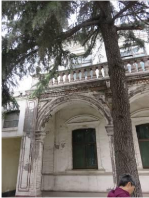
De voorkant van het vroegere bisschopshuis.