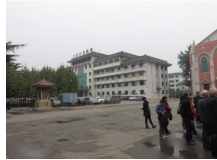
Het grote militaire ziekenhuis op de plek waar Schraven met een ziekenhuis begon.