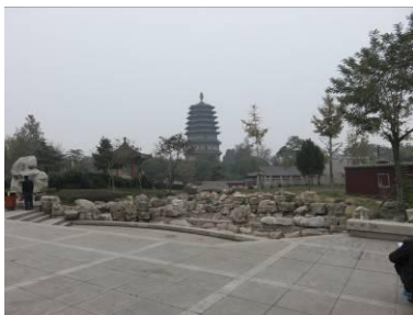
Een toeristische attractie.