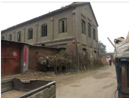
Helemaal in verval.