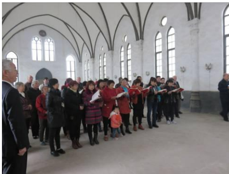
Een hartelijk afscheid.