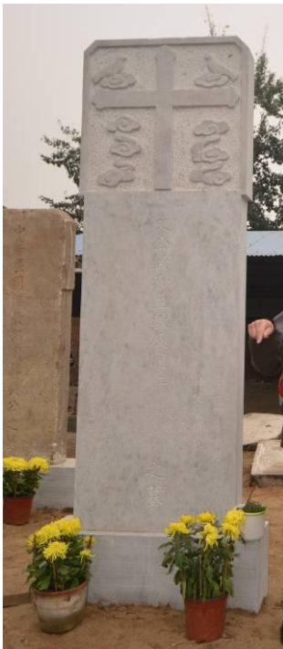
Onder de nieuw grafsteen voor de martelaren.