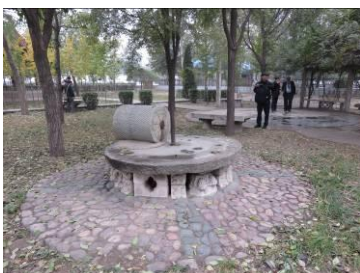
Resten, gesloopt uit de kathedraal: