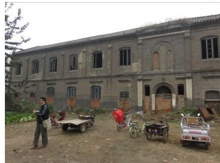
Beneden de vroegere kapel.