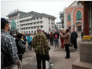
Iedereen luistert naar de uitleg over het Japanse monument rechts op de foto.