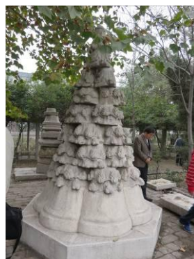
basementen van pilaren en een altaarblad.