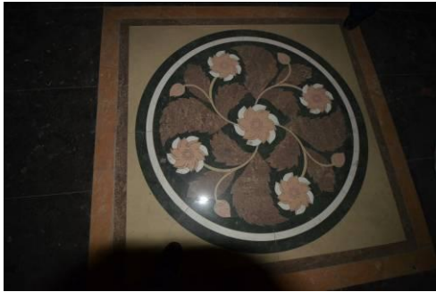
De vloer voor het vroegere altaar.