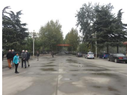
kijk je naar de Zuidpoort van de Chinese monument nog net wonder dat meer dan 10.000 opgevangen.