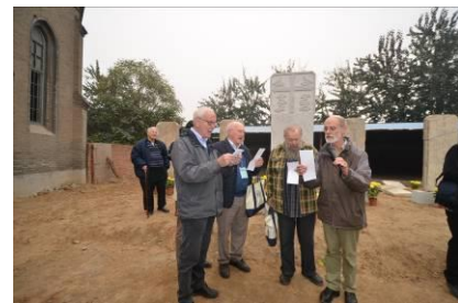
Op de begrafenis klonk het Franse lied zo...