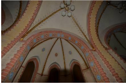
Achter het podium (zie vooraanzicht) herken je het vroegere priesterkoor.