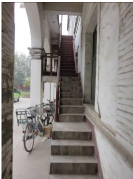
De achterkant van het bisschopshuis.