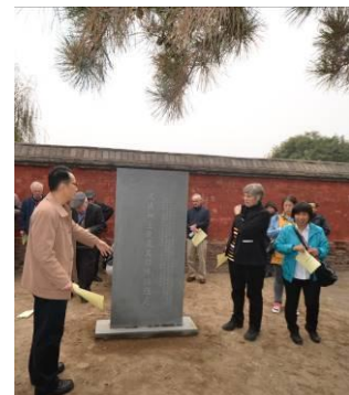
Het nieuwe monument.