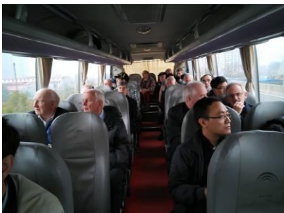
Op de terugweg naar het hotel. Wat valt er nog te zeggen als iedereen zo onder de indruk is van deze excursie?

Secretariaat Mgr. Schraven Stichting: Kloosterstraat 54, 6369 AE Simpelveld, tel. 0455445419 Email: info@mgrschraven.nl Website: www.mgrschraven.nl Facebook: www.facebook.com/mgr.schravenstichting Bankrekening Mgr. Schraven Stichting: IBAN: NL74RABO0148175341 BIC code: RABONL2U. Voorzien van de ANBI-status.