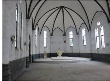
Het interieur van de kapel.