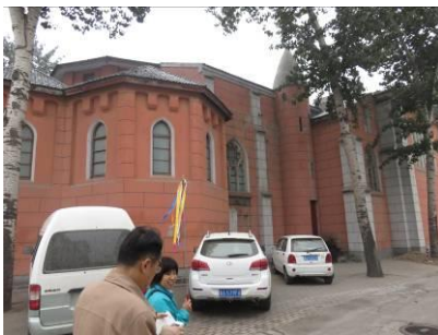
De achterkant van de vroegere kathedraal en ...