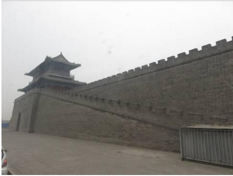
De stadsmuur van Zhengding.