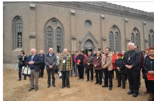
De martelaren gedenkend...