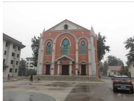
de onttakelde voorkant.