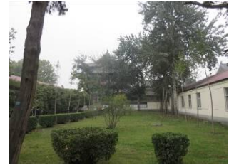
Een blik op de aanpalende tempel.