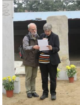
De achterkant van het monument