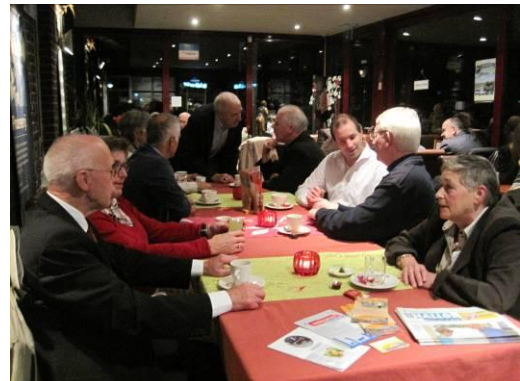
Na afloop gezellig samenzijn.