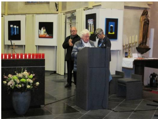
Tijdens de kruisweg op 9 oktober.