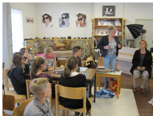
De kinderen aan het werk met de lesbief.

'Mevrouw Peeters kan op een prima manier de belangstelling van de kinderen wekken', zo schreef na afloop de voorzitter van de Schraven Stichting. Het werken met de lesbief beviel goed. Ook pastoor Verheggen kwam zijn belangstelling tonen.