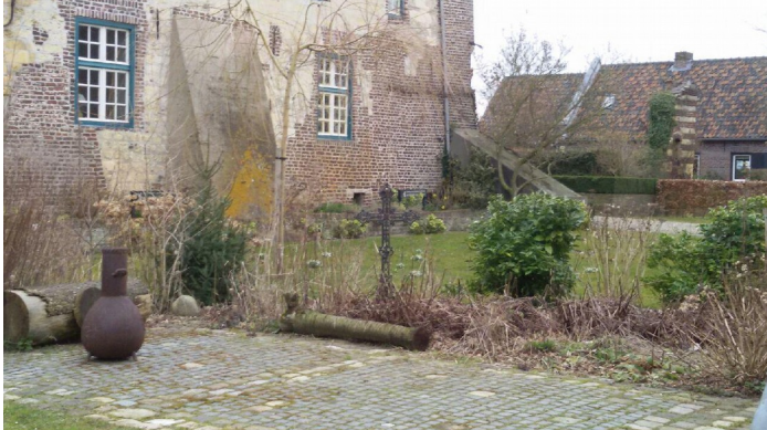
De plaats van het kruis op Kaldenbroek.