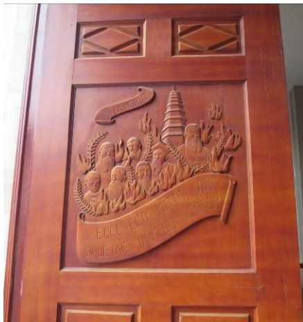
De hoofddeur met het tafereel van de massamoord.