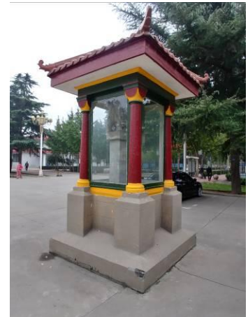
Het monument van de burgers.