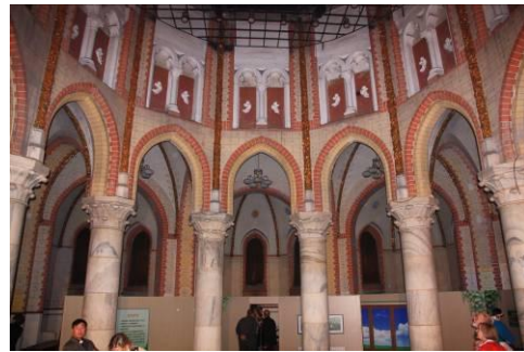
De vroegere kathedraal.