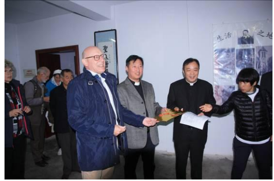
Overhandiging van een speciaal cadeau door de voorzitter van de Schraven Stichting aan de pastoor.