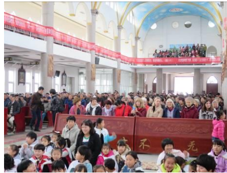
Ereplaatsen voor de 30 gasten uit Europa.