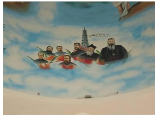
In de koepel van de kerk opnieuw de martelaren, slechts 7 van de 9.