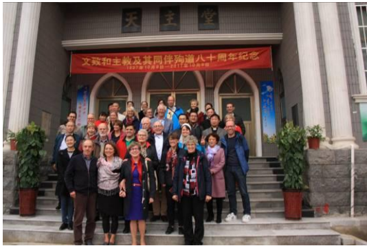
Een groepsfoto voor de kerk van Zhengding.