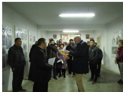
Bezoek aan het Schraven museum.