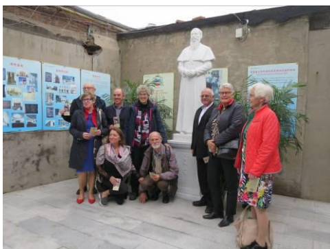
Leden van de familie Schraven bij het beeld.