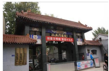
r. De beruchte Zuidpoort waarlangs ze werden weggevoerd.