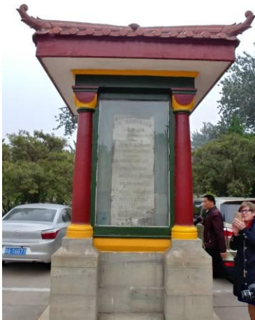
Het Japanse monument.