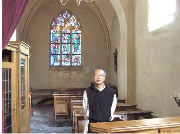
In de toekomstige gedachteniskapel te Broekhuizenvorst.