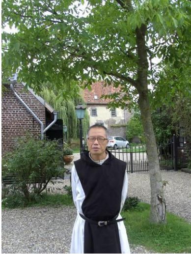
Voor het geboortehuis in Lottum.