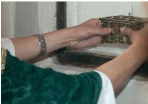
De as van de martelaren in de kapel

De gedenkkapel in Broekhuizenvorst is een gunstige accommodatie om bezinningstoerisme te bevorderen. De sfeervolle kerk is geschikt om grotere groepen bezoekers te ontvangen. Na een verbouwing van het priesterkoor is ook de kerk geschikt voor het houden van lezingen, tentoonstellingen en het vertonen van films.