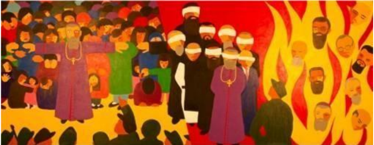
Een van de panelen: verdediging van vrouwen... geboeid... verbrand.