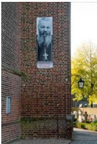
Links: bisschop Frans Schraven

Pas de laatste jaren zijn er feiten omtrent hun marteldood door onderzoek in archieven in Europese landen, in China en Japan aan het licht gekomen. In 2008 is de Mgr. Schraven Stichting in het leven geroepen met als doel het voorbeeld van de martelaren in onze tijd na te volgen door zich in te zetten om seksueel geweld tegen vrouwen te voorkomen en solidariteit met slachtoffers ervan te bevorderen. Tevens wil de Stichting aan het levensverhaal van bisschop Schraven en diens levenshouding grotere bekendheid geven en navolging ervan bevorderen via allerlei activiteiten.