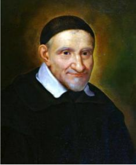
Vincent de Paul

Een spiritualiteit ook die in onze dagen aandacht krijgt door het optreden van paus Franciscus. In Nederland zit de aandacht voor deze spiritualiteit in de lift door de oprichting van het Vincent de Paul Centrum in Nijmegen waar de Leergang 'Vincentiaanse Spiritualiteit' in Nederland wordt gegeven.