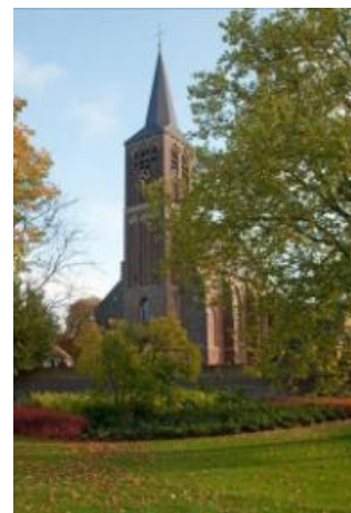
Rechts: de parochiekerk van Broekhuizenvorst.