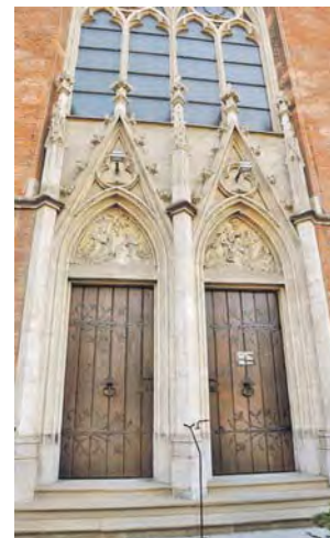
Svoju mladu misu Češka je proslavio u lazarističkoj crkvi Gospe Žalosne u Grazu