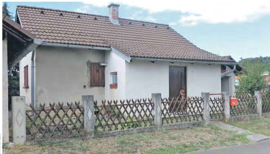
Tomaš Češka rođen je 1872. u jednoj od triju željezničkih stražarnica koje se i danas mogu vidjeti u općini Brdovec, a najvjerojatnije je baš riječ o kući u brdovečkoj Ulici Nikole Širanovića

Otkrića o Čebu rođenu u Hrvatskoj i odraslu u Austriji koji je kao lazaristički misionar podnio mučeničku smrt u Kini