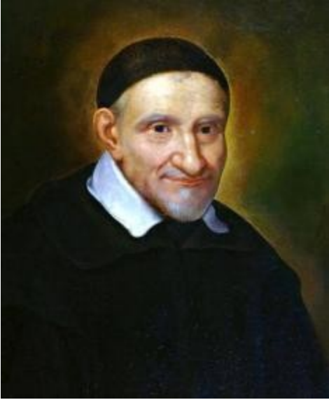
Vincent de Paul

Een spiritualiteit ook die in onze dagen aandacht krijgt door het optreden van paus Franciscus. In Nederland zit de aandacht voor deze spiritualiteit in de lift door de oprichting van het Vincent de Paul Centrum in Nijmegen waar de Leergang 'Vincentiaanse Spiritualiteit' in Nederland wordt gegeven.