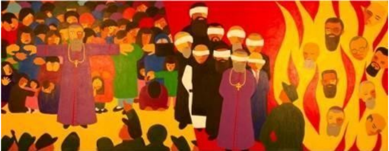
Een van de panelen: verdediging van vrouwen... geboeid... verbrand.